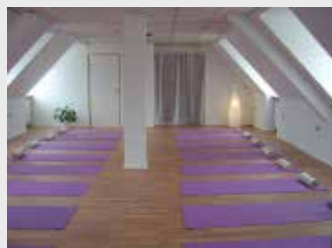
Meditationslokalet Nørregade 41. Der er også almindelige stole til siddemeditation.

Hvis du har brug for at overnatte i København, kan du finde steder til rimelige priser på www.bedandbreakfast.dk